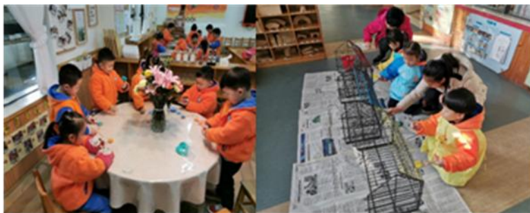
图2-3-1 孩子们为开超市而忙碌