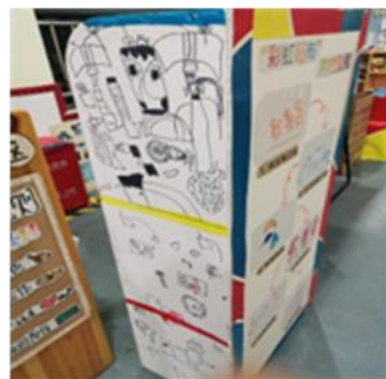
图2-3-2 分工装饰的货架

教师支持： 如果完全让幼儿自己按照设计图创设超市区，会面临很多困难和问题。因此教师和幼儿一起对超市设计图进行了“解剖”，明确超市布置的具体内容，幼儿自由选择参与哪一部分的布置。在绘画装饰组出现问题的时候，教师没有直接介入，而是在一旁观察，给予他们自主解决问题的时间。超市区的装饰完成了，有幼儿提出了想在里面买自己喜欢的东西，但是也有幼儿发现超市空空如也，还买不了东西，于是教师与幼儿一起讨论我们的超市里要卖哪些东西。在幼儿有了买卖期待后，教师向幼儿提出了任务：去超市调查有些什么商品？是如何摆放的？并用思维导图的方式记录下来。同时请家长支持孩子完成任务，为后面布置超市区提供重要的依据。