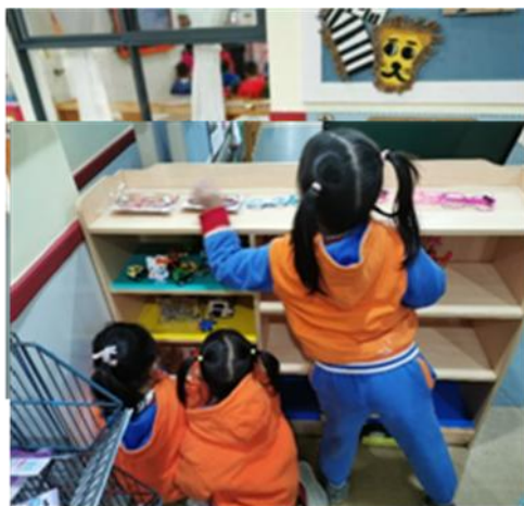
图2-3-6 小朋友在选购商品

观察记录： 超市准备开张了，吸引了很多幼儿积极选择超市区，但是名额有限。选上超市区的幼儿都准备好了零钱，但没有