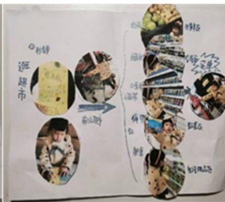
图2-3-4 超市购物思维导图