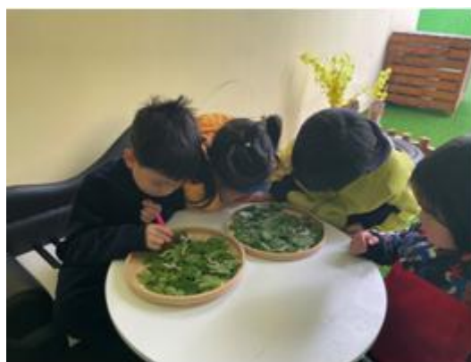
图 1-3-1 蚕宝宝吸引了孩子们

行为解读： 幼儿通过看一看、摸一摸、说一说走进了探索蚕宝宝的世界。他们初步发现了蚕宝宝的外形特点，有黑点点、软软的等特征。对于不动的蚕宝宝发出了质疑。