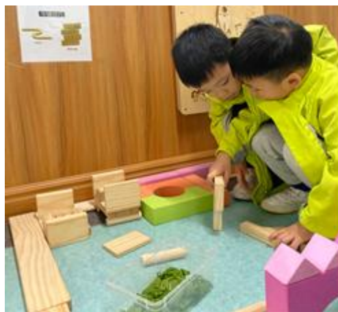
图 1-3-3 商量着为蚕宝宝搭建一个家

观察过程： 区域时间，孩子们提到蚕宝宝的房子就像一个小小的鸡蛋，究竟蚕宝宝会有什么样的房子呢？这个问题引发了孩子们的激烈探讨。蚕宝宝的房子肯定有一张大大的床，于是孩子们给蚕宝宝搭建了一张大大的床，并且细心的给床安装了防护栏，避免蚕宝宝摔下去。“还有一片大桑叶园吧！这样蚕宝宝就不会饿肚子了”，孩子们一边讲一边搭建（图 1-3-3），于是，一边桑叶园出现在了蚕宝宝的“家”。“蚕宝宝无聊了怎么办？”“给他搭一个游乐场吧！这样他就有地方玩啦”孩子们你一言我一语，耐心而细致地搭建了一个只属于蚕宝宝的“家”（图 1-3-4）。