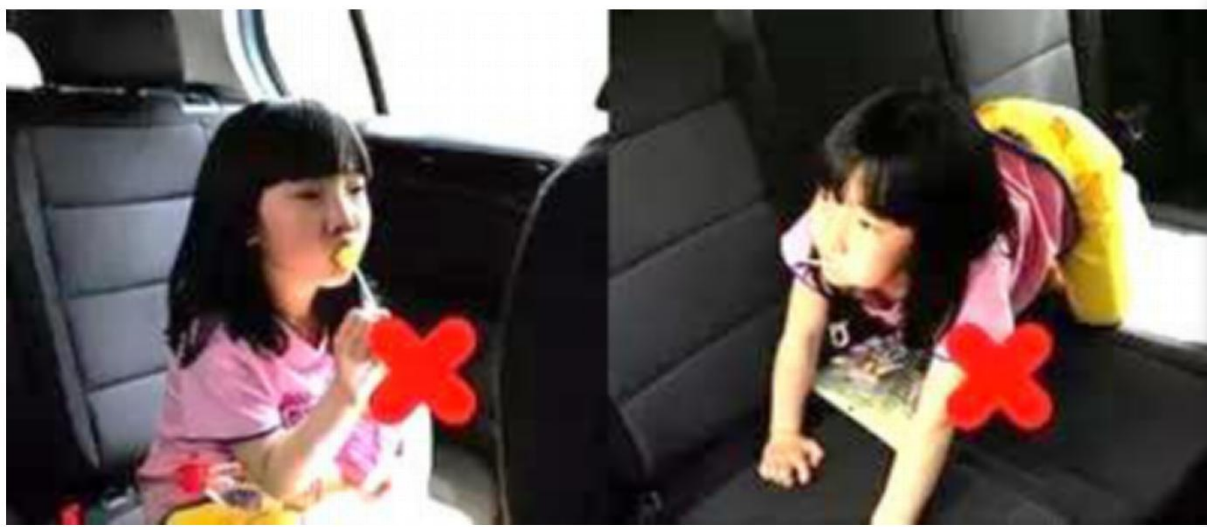
车上不能吃棒棒糖，不要爬