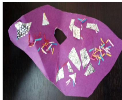
“葡萄味的，中间的洞小因为这样就可以吃得多一些”