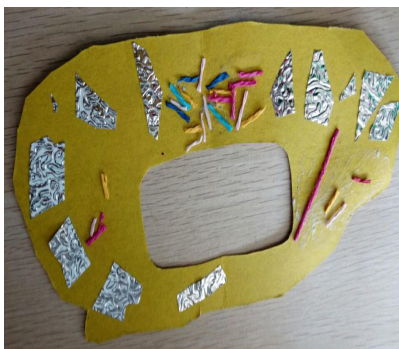
“香蕉味的，上面撒了会发光的东西，特别好吃”