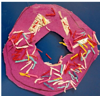
“草莓味上面有各种各样口味的彩虹糖”