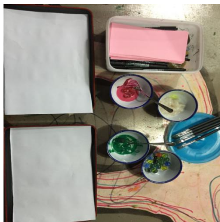
工具准备（水粉颜料）